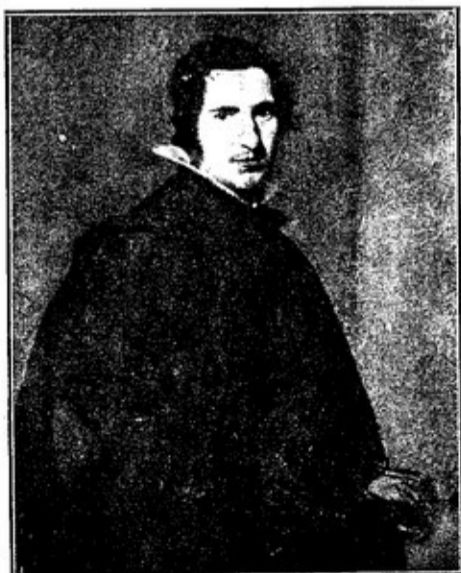
МЛАДЪ ИСПАНЕЦЪ Отъ ВЕЛАСКЕЦЪ