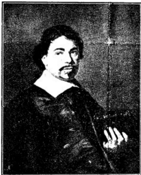
Портретъ на ХОНЕБЕКЪ Отъ Р. ХАЛСЪ