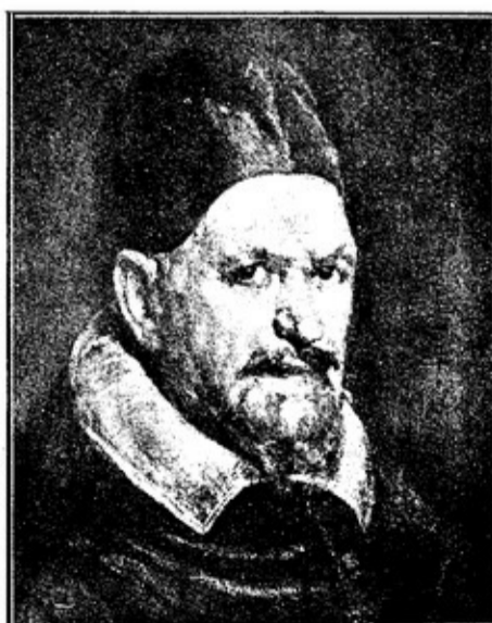
ПАПА ИНОКЕНТИЙ Отъ ВЕЛАСКЕЦЪ