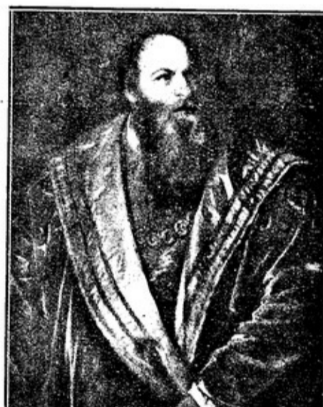
АРЕТИНО Отъ ТИЦИАНЪ